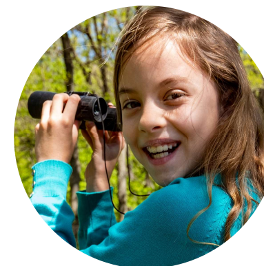
Erlebnis für die ganze Familie