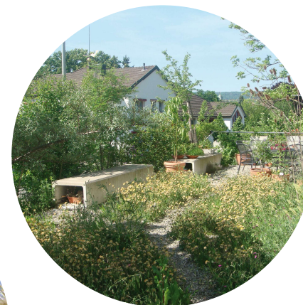
Sensibilisierung für Zusammenhänge